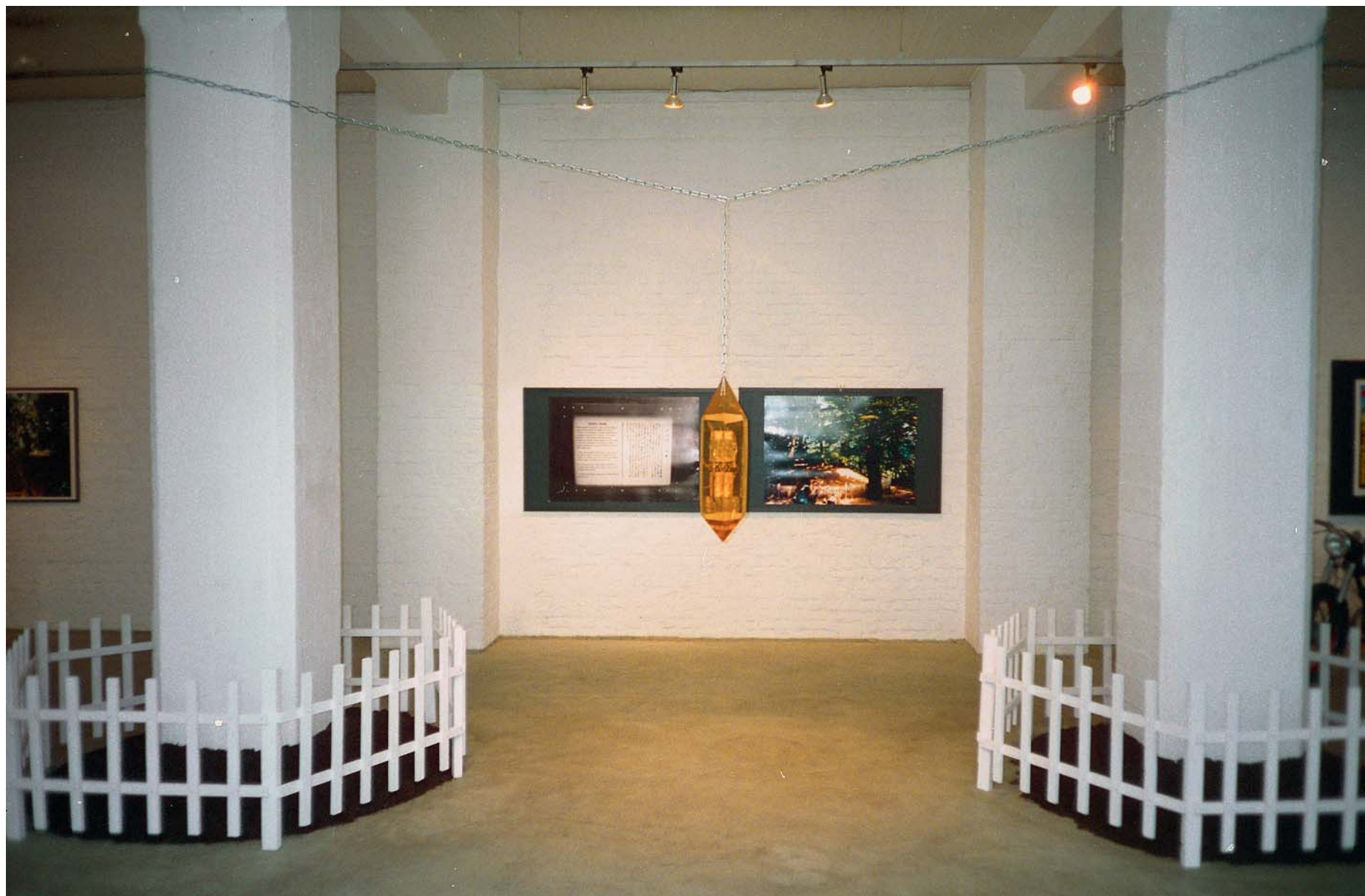
Фрагмент инсталляции. Центральная часть / Installation detail. Central part